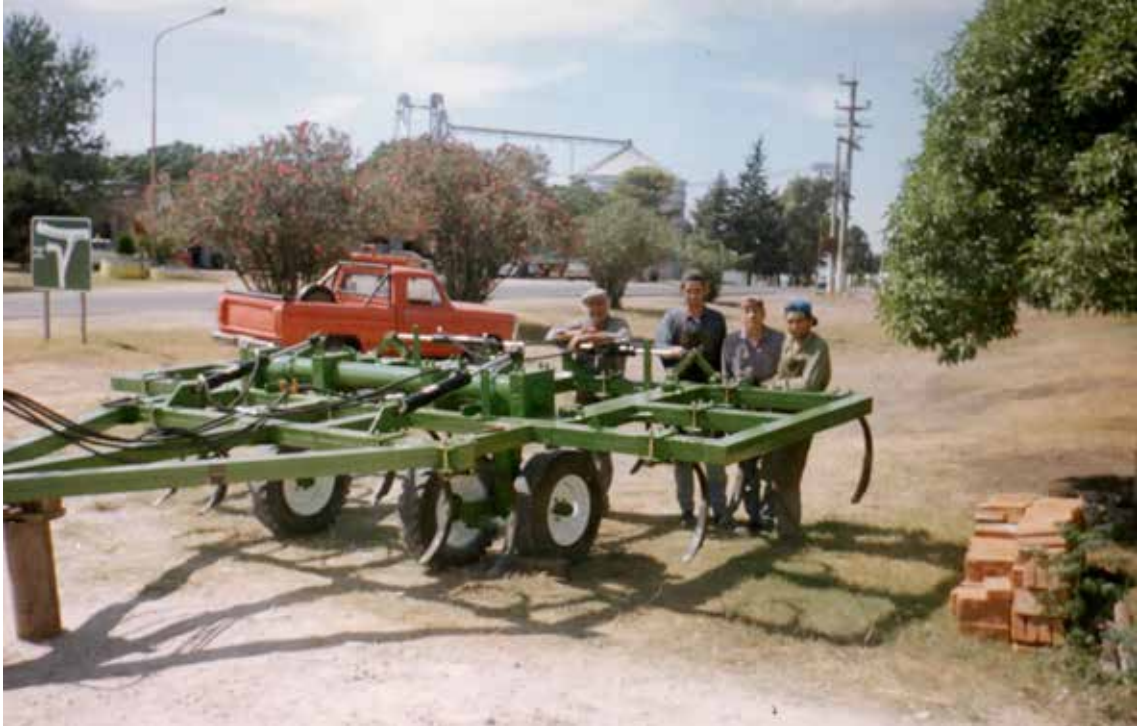
Un rastrón fabricado por la empresa. Al fondo la F-100, nuestro primer vehículo, que todavía conservamos. Año 1999.

tomé en febrero del 97, hoy es nuestro jefe de taller, hoy está su hijo técnico trabajando con nosotros.