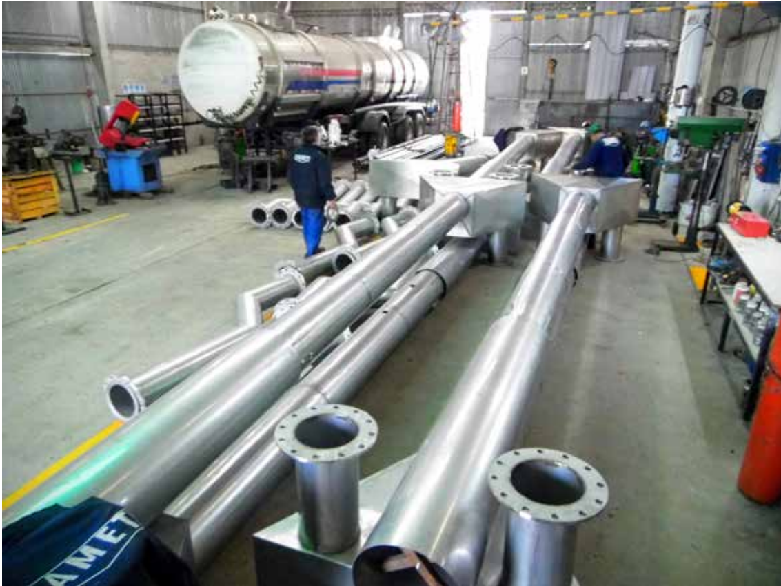
Chimeneas inoxidables para Sullair, central Bandera en Santiago del Estero. 2015.