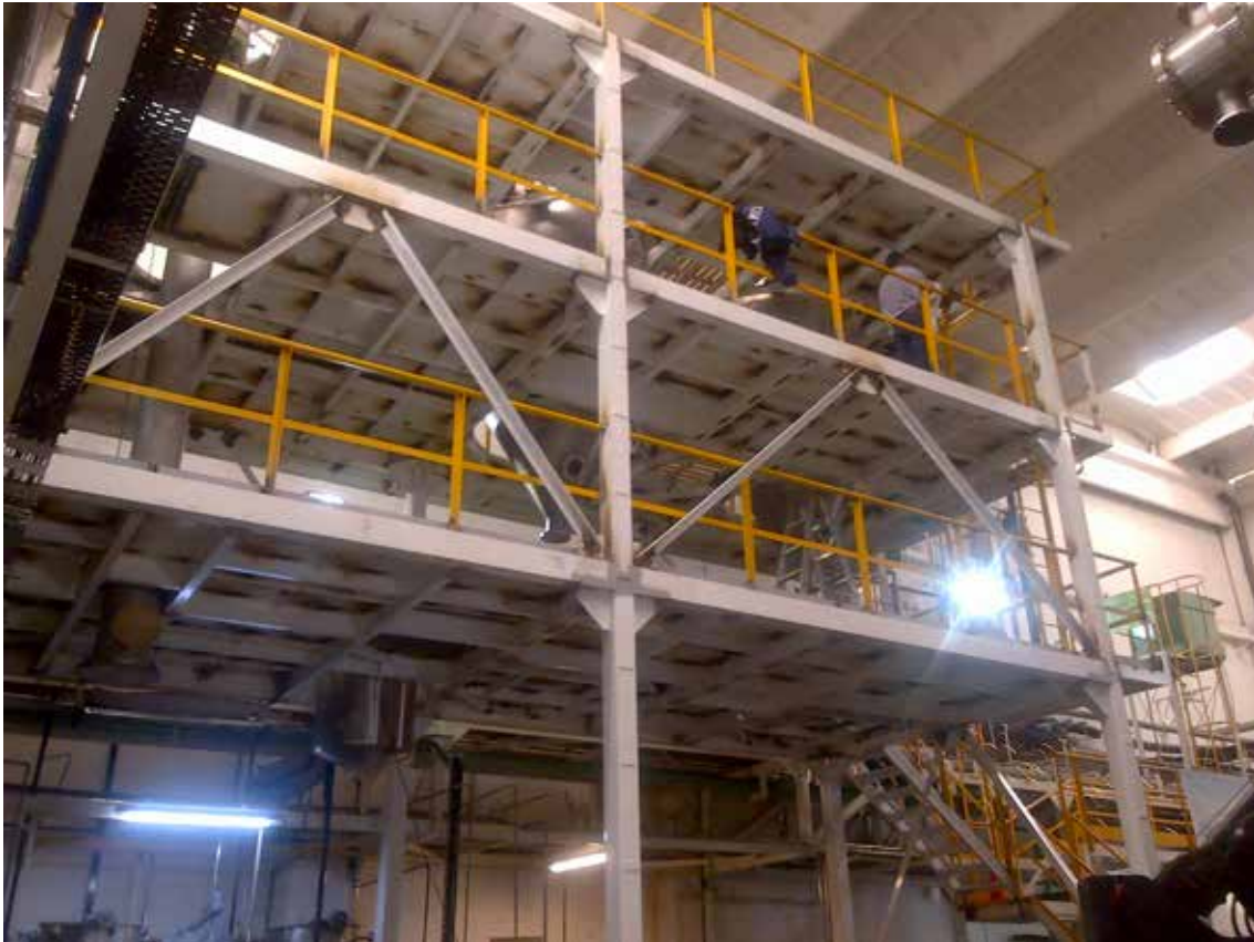
Estrucura R-51 para Unilever, Parque Industrial Gualeguaychú. 2015.

La participación en gremialismo empresario me aportó mucho para mi experiencia en el manejo de la empresa y el compartir problemas y logros.