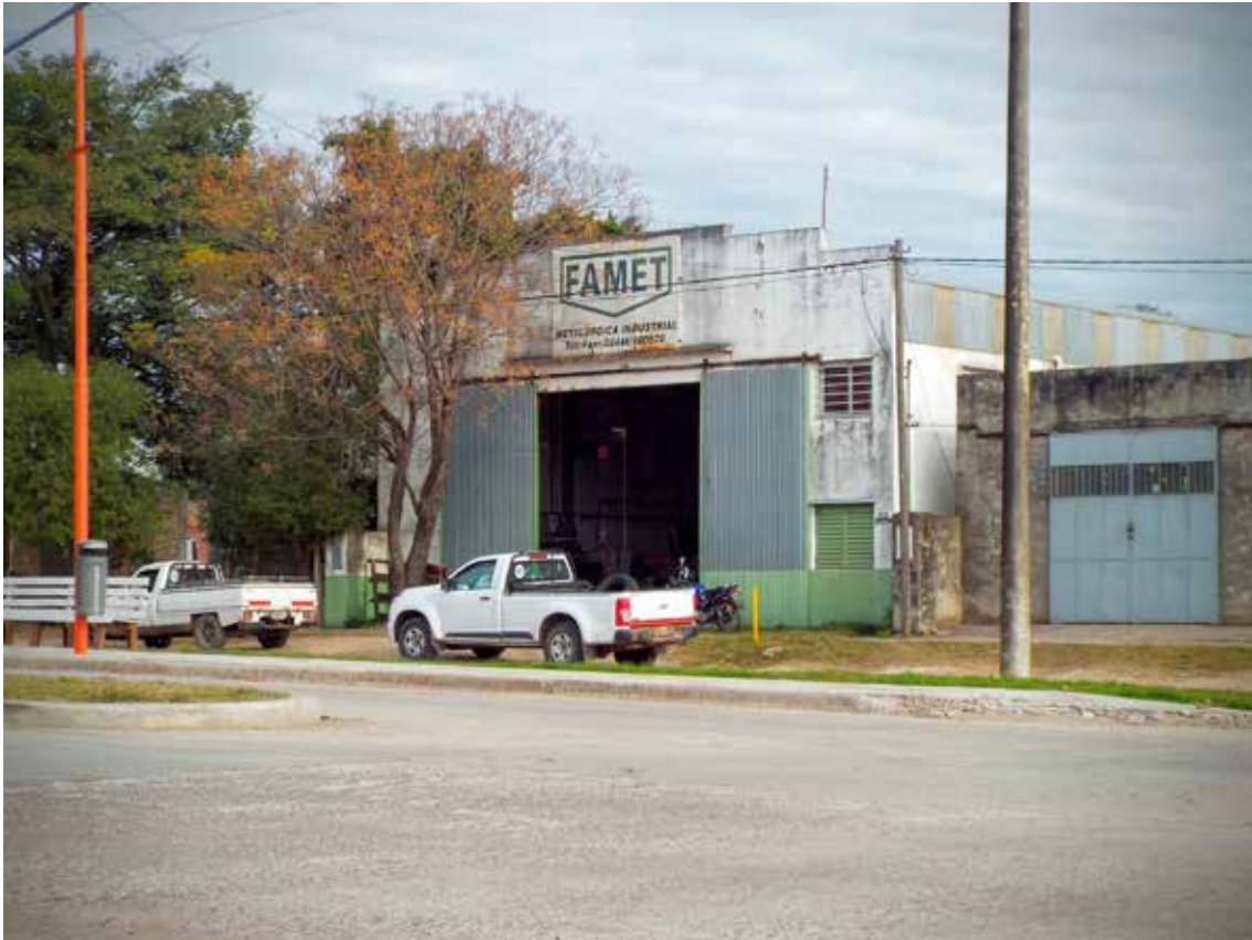
El taller Urquiza.